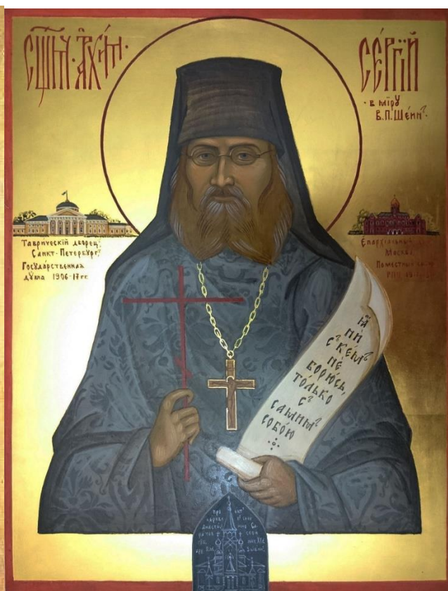
Иконы: митрополита Петроградского Вениамина и Архимандрита Сергия (Шейна)