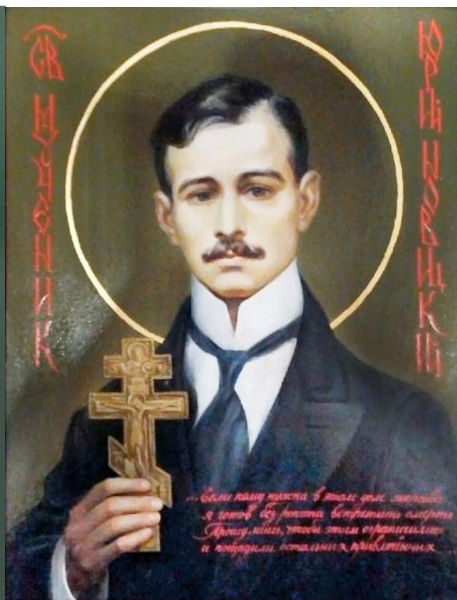
Иконы: Иоанна Кавшерина и Юрия Новицкого