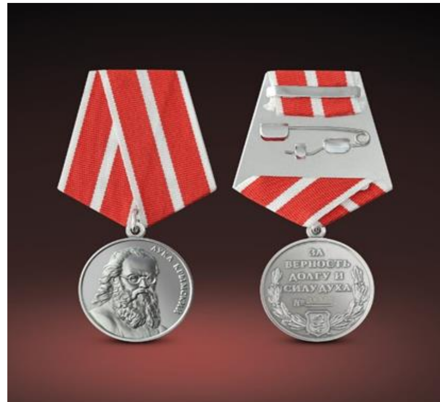
Медаль Луки Крымского