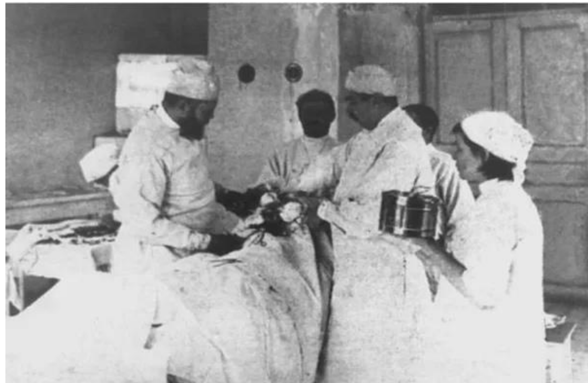
В.Ф. Войно-Ясенецкий на операции, 1904 г.

«...В маленькой участковой больнице на десять коек я стал широко оперировать и скоро приобрел такую славу, что ко мне пошли больные со всех сторон, и из других уездов Курской губернии, и соседней, Орловской».