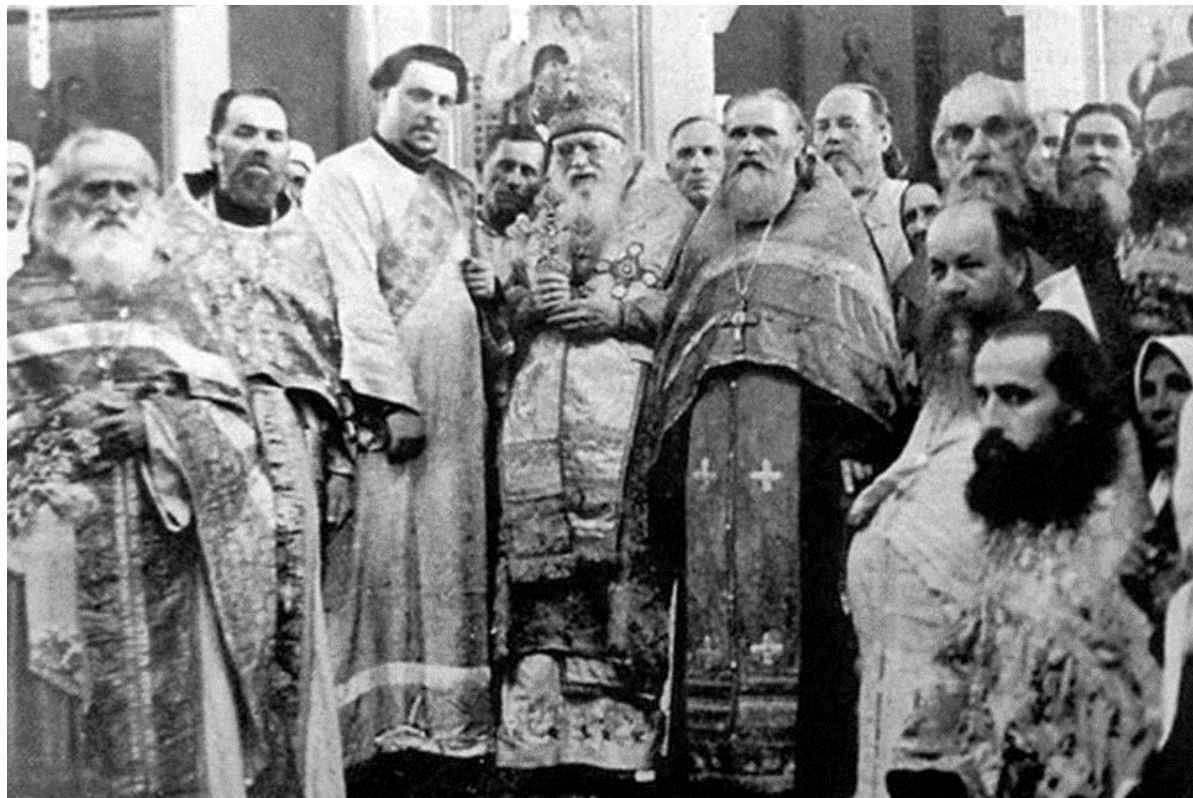
В Свято-Троицком соборе Симферополя