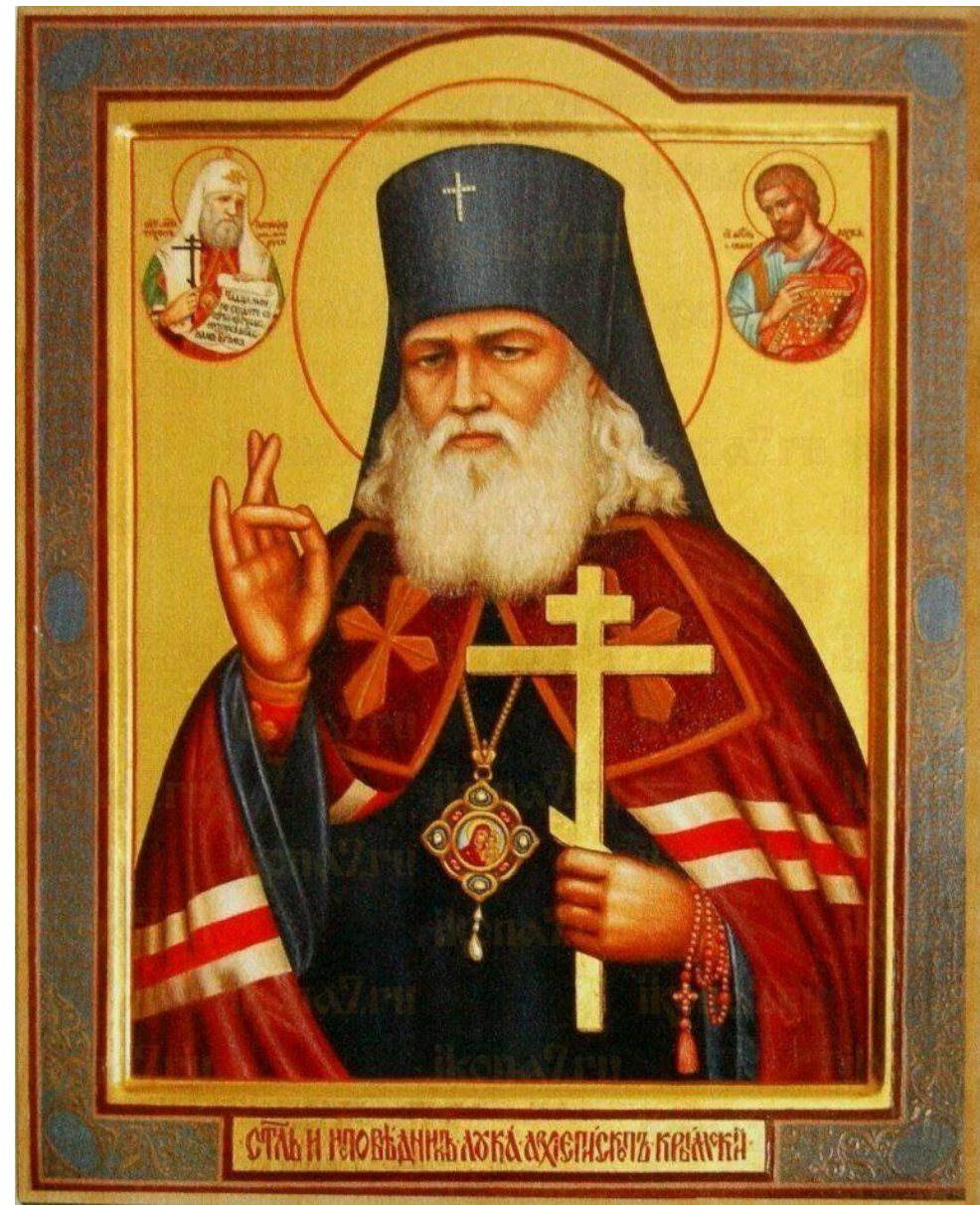
Икона Луки Крымского

Ученый с мировым именем, профессор хирургии и топографической анатомии, один из основателей регионарной анестезии и гнойной хирургии, доктор медицины, религиозный деятель и духовный писатель, доктор богословия, архиепископ Симферопольский и Крымский.