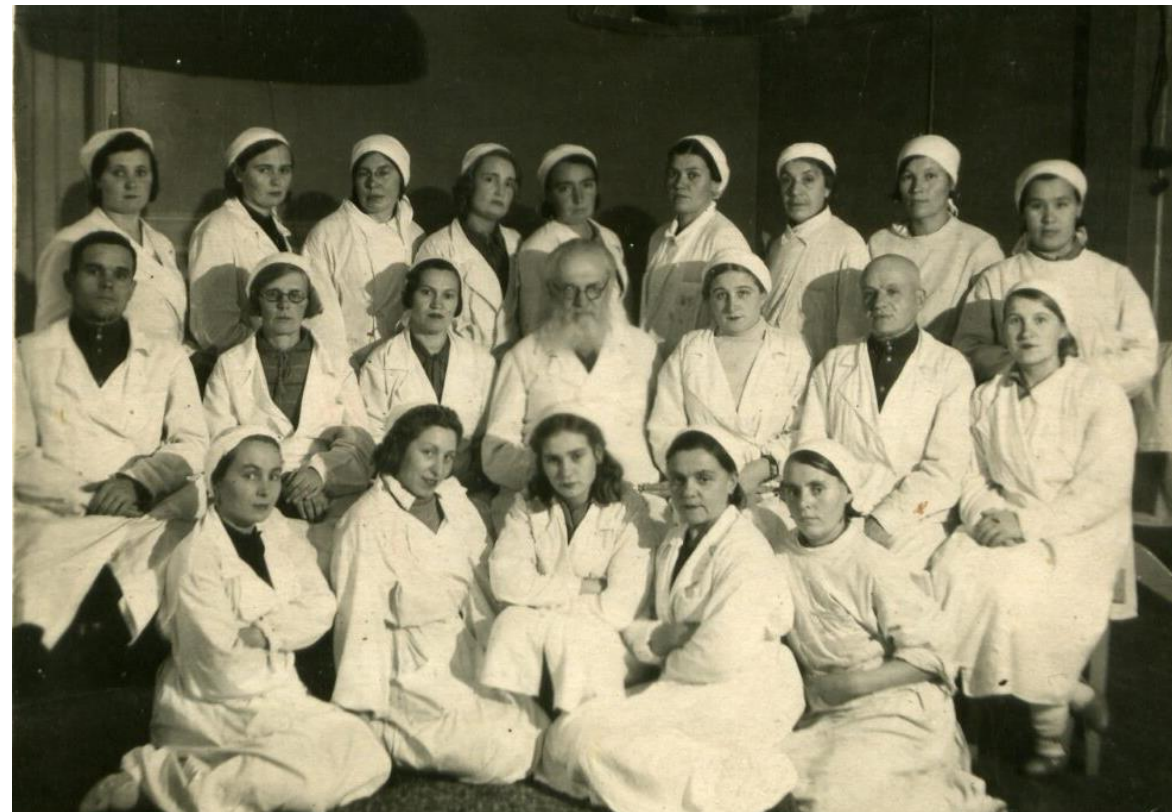
Святитель Лука в красноярском эвакуационном госпитале №1515

«Даже если бы не изменилось столь существенно положение Церкви, я не поколебался бы снова вступить на путь активного служения Церкви»