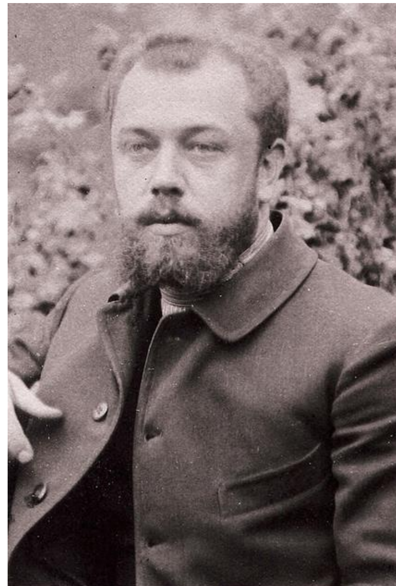
Валентин Феликсович в студенческие годы

«Недолгие колебания кончились решением, что я не вправе заниматься тем, что мне нравится, но обязан заниматься тем, что полезно для страдающих людей»