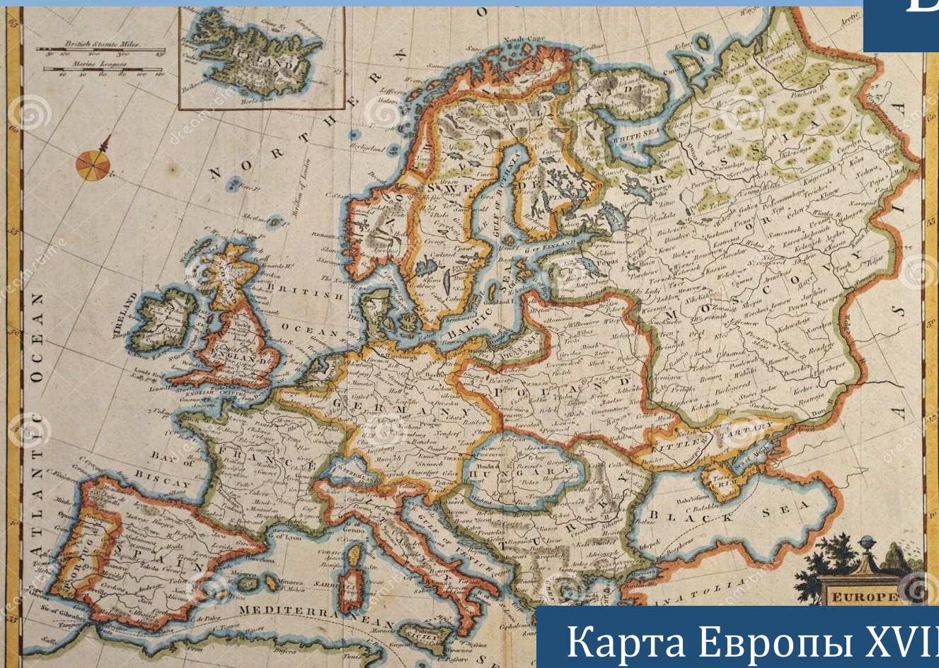
Карта Европы XVIII века